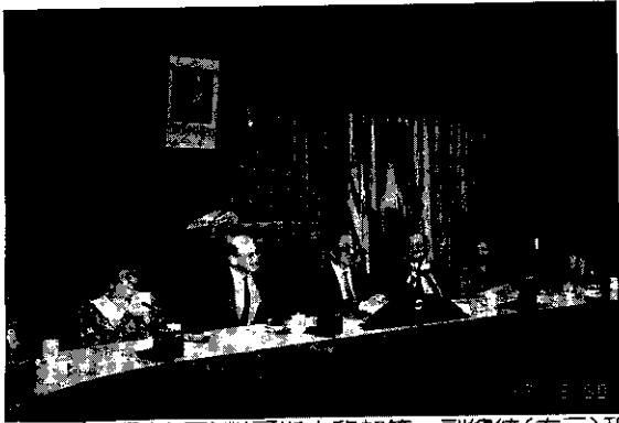
張訓舜所長(右四)對哥斯大黎加第一副總統(右三)和巴拉圭農業及畜牧部部長(左三)的訪問表熱誠的歡迎

目前世界上尚有許多國家仍面臨地權分配與土地利用問題。如何訂定合理之土地政策，實施農地與市地改革，適當規劃土地利用，建立公平之土地稅制度，以使地盡其利，地利公享，促進國家經濟建設，提高人民生活水準，均須積極進行研究。對於執行土地政策之人員，尤須加以訓練，以應各國之需。