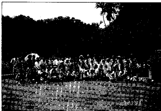
一趟火車之旅，大家來合照留念

火車快飛，火車快飛，穿過高山，渡過小溪……這首琅琅上口的兒歌，在集集火車輕快悅耳的汽笛聲伴奏下，響遍了我們這一群搭乘火車，來一趟知性之旅的團體。