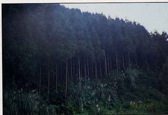
優美的私有林柳杉造林地

→ 廣，使本省之私有林林業，能負起生產省內用材之部分責任外，更能創造出優美而有活力的富麗、快樂的山村，使其成為國民嚮往的美麗自然環境之休閒育樂圈。