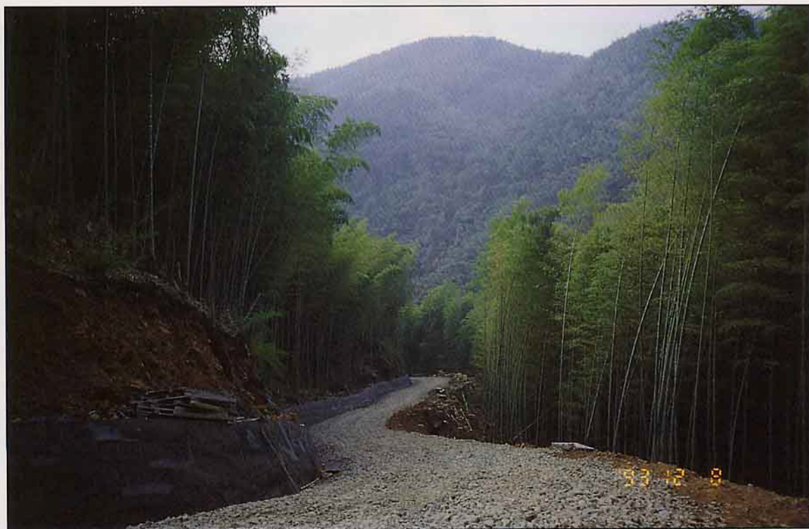
改善後的林道與優美的孟宗竹林

台灣省私有林面積有18萬6千多公頃，占林野總面積232萬9,800多公頃中之7.98%，筆數28萬5177筆，平均每筆0.65公頃，甚為零星。每公頃平均蓄積量僅有21立方公尺。現有造林木，多屬短伐，期樹種之廣葉杉、相思樹、油桐，疏球松及竹類等。（詳見表1：台灣省私有林概況表）。私有林因大部分屬經濟林人工造林地，將之與國有