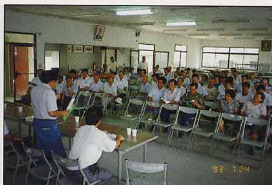
私有林經營改善林農說明會