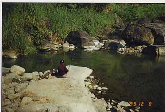
小溪流憩地改善提岸美化工程