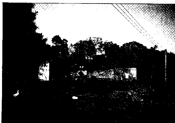
簡陋的山區林農住家