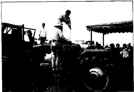
真空雙層施肥播種機，填加肥料

本省飼料玉米之生產主要供做畜牧養殖，部份則做為加工原料之用。60年代以前在政府確保軍精民食，鞏固國防、安定民生之糧食生產政策下，稻米之安全生產是政府施政重點之一。因此，飼料玉米在當時栽培面積有限，而本省又位處亞熱帶，高溫多濕，季節風及豪雨等災害發生頻繁，甚不利高莖作物之種植生產。但60年代以後，隨著國內經濟快速成長，國民所得之提高及教育之普及，國人原以稻米為主的飲食習慣，改變以魚肉蛋類為主的消費型態。因此，稻米消耗量逐年遞減，相對的使得稻米年年生產過剩，導致倉容及政府財政負擔加重，政府遂於民國73年起推行稻田轉作政策，平衡稻米產銷，以紓解政府之財政壓力。而在此政策下，飼料玉米是政府輔導轉作作物之一。自此之後，其栽培面積急速增加，到78年已達6萬7千多公頃，比72年增加2.3倍。公頃產量在78年為4,202公斤，較72年之3,230公斤增加1.3倍，78年的年產量為37萬6千多公噸，較73年增加3.3倍。顯示政府推行稻田轉作政策之後，由於飼料玉米品種改良與栽培技術之改進，加上政府保價收購之獎勵，提高農民種植意願，使稻田轉作玉米獲致顯著之成效。唯相對於美、澳等大規模機械化玉米生產國家，本省玉米產銷成本仍屬偏高。因此，為應因政府積極尋求加入國際關