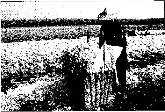
用竹籃裝運也很傳統

出，近年來新園鄉芹菜生產面積很穩定，一年維持在80~100公頃。其原因倒不是他們有什麼計畫生產，因為到目前為止，農會還未針對芹菜成立產銷班。根據郭先生的推測，應該是芹菜無法連作所至。因為無法連作的話，想種芹菜必需找二年內未種過芹菜的農田才可以，然而，大家耕作面積有限，要