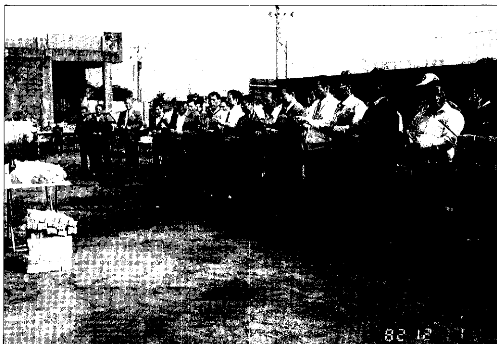
麥寮鄉農會橋頭分部大樓，破土開工，農友們祈禱順利完工。

先興建3樓及地下室，今後將方便麥寮北邊5個村（橋頭、三盛、施厝、新吉、雷厝）的3000多戶會員落實服務，新大樓完成後，將經營超級市場，以平價供應日用品，一樓為信用部辦理存放款業務，2樓辦公室，3樓將設立農業推廣教育中心及農友集會活動中心，提供廣大農民們多元化的服務，將帶給地方民衆更多的方便與服務。(陳慶元)