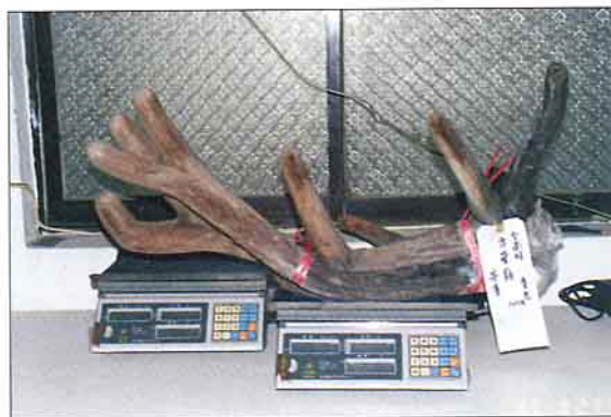
電子磅秤(麋鹿鹿茸一對120台兩)