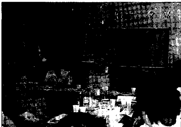
簡介養鹿事業與「鹿茸酒」之產銷，圖為台灣養鹿合作社施理事主席

台灣早期，因較少猛獸出沒，是以野鹿（梅花鹿與水鹿）遍地，原住民所從事之野獵，又均以鹿隻為對象，始有過去以大量鹿茸、鹿皮等特產，往由鹿港（彰化縣轄）出口到大陸之廈門（福建省），交換糧鹽等民生物資之史實。至本省民間鹿隻之馴養，自清朝以來，雖有約300年之歷史淵源，惟養鹿事業之起步，則由於國人偏愛「鹿茸」（視為至寶，公認能益血助陽強筋健骨），且隨國民生活水準之提升與養鹿業者對鹿隻圍飼技術之改進，於近30年才發生（按未經