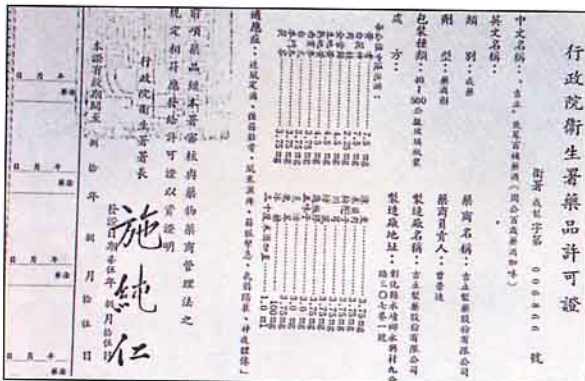
獲得行政院衛生署認定的藥酒處方許可證

民間鹿茸交易正常之行情；同時極力推展養鹿事業，係鑑於鹿隻之產茸期可長達18年，每年皆可採收鹿茸，雖然其飼養管理難度較高、投資頗巨，惟收益亦較優厚（按鹿茸出售時，以兩論價，如梅花公鹿平均年產鮮茸60台兩，單價800元，時價可達48,000元），而其生產成本尚較其他畜牧業為低（除種鹿負擔較大外，草料之消耗僅及羊隻百分之三五），自屬極有前途之「精緻農業」，即行建議政府將鹿隻納入「家畜管理」，並敦請海關嚴防「鮮茸」走私進口，幸蒙行政院農業委員會及台灣省政府於78年公告，正式列為「家畜」，納入輔導管理，農林廳並逐年編列經費預算，積極辦理鹿隻飼養技術改進，推展防疫工作，且建立病鹿撲殺補償制度；尤經本社多年舉辦各地鹿農（含社員）防疫講習訓練與在組織高度運作之下，目前各地社員鹿場計有239戶（組織之規模仍將繼續擴大中），飼養各種鹿隻約11,700頭，