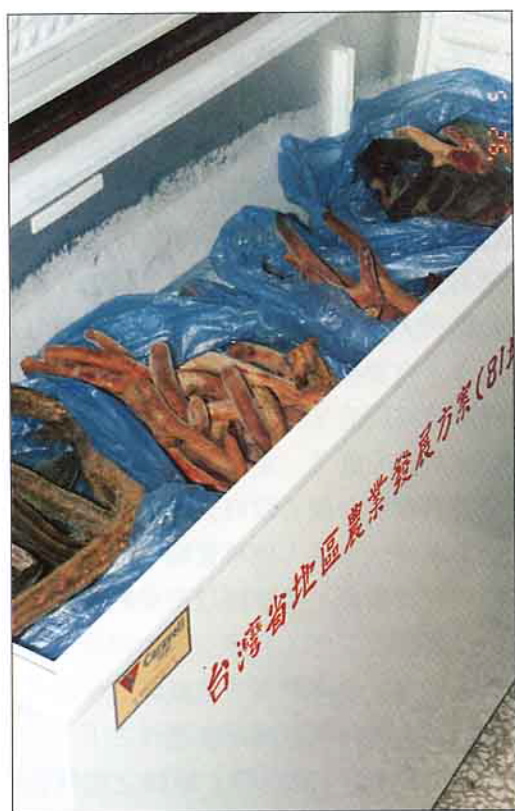
鮮茸放入冷凍庫儲藏包裝

「參茸酒」，均須大量採購進口原料乾鹿茸等事實。合作社為期養鹿事業早日擺脫以上困境，建立省產鹿茸產銷長期穩定之局面，進而維護鹿農之應有權益，曾先後歷經4年，積極向政府機關之行政院農業委員會、審計部、農林廳、合作事業管理處、民意機關之立法院、監察院、省議會及公賣局等，作近百次之陳情與交涉，始自80年元月商獲正式協議：由公賣局開發新產品「鹿茸酒」，每年向鹿農團體（各鹿產品運銷合作社）定量標購所需原料之「省產鹿茸」；遂自80年元月至82年7月止，經分6批向省鹿產品運輸合作社標購省產鹿茸共72,368.4台兩（合乾茸927公斤），計價款達48,663,720元（請參考附件1.）；復因公賣局所製售之鹿茸酒，促銷成績良好（按該局隆田酒廠供應上市之鹿茸酒，係循古法以省產鹿茸、香辛料及自行釀造之米酒頭加工泡製3個月以上，品質優良，民衆可安心消費），而所標購之原料鹿茸，係來自合作社統籌由各縣社員鹿場所供應，且屬較大量整批之交易，是以其每台兩所標購之單價（一級品）641元，已被廣視為鮮茸批發交易公開之行情。目前民間每台兩鮮茸之零售交易價格：南部產地為800元，中北部消費地已達1,000~1,200元；鹿隻民間交易之行情，亦逐漸恢復至全盛