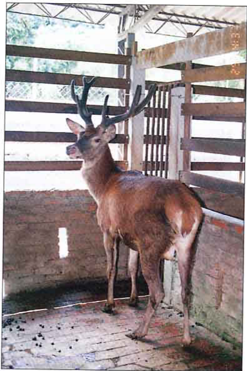
本省養鹿，值得推廣之品種：水鹿

鑑於國內外盛行消費之鹿茸產品「鹿茸酒」及「鹿茸」，對鹿茸之成份與效用，業者均有極高之評價（容另行提供）。合作社為期早日改變養鹿業者僅出售原料鹿茸之現況，提升鹿產品之附加價值，增加鹿農收益，經全力運用整體組織資源—人力與資金，以自創「台鹿」品牌（申請中央標準局商標註冊證號：〇〇四七三七九八），自79年3月起，成功開發鹿產品自營運輸業務，如製售「鹿茸百補藥酒」、「鹿茸百補酒」、「品品酒」等，以上酒類且均承衛生署藥酒處方（成製字第〇〇六八六五、〇〇六八六六號）之許可及接受商品檢驗局產品合格之抽驗；又因其產品深獲消費者之信賴，致每年