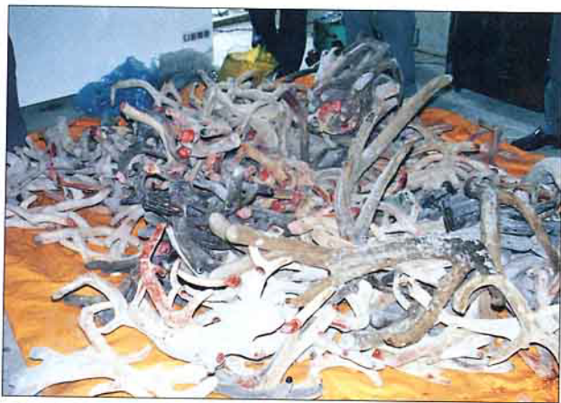
本省鮮茸送達公賣局隆田酒廠驗收

本省養鹿事業，正朝向專業化經營型態推展，實屬可喜現象；惟目前飼養各種鹿隻之品種，其鹿茸之單位產量，卻有逐漸退化問題（多因近親交配）有待提升，而鹿隻之飼養管理技術，亦有待普及；特建議政府農業部門早日籌設國家級「種鹿繁殖場」1~2處，以專責繁殖優良之種鹿，供應民間養鹿業者飼養推廣，或委託省鹿產品運銷合作社定期選拔民間具有經營種鹿條件之鹿場，