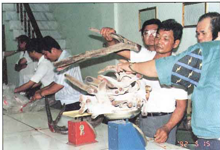
鮮茸之過磅與驗收

→ 輔助成爲民間「種鹿繁殖場」，並採取各種協助措施，如獎助進口優種鹿，提供指導技術，舉辦講習觀摩活動等，以利迅速大量繁殖本省所必須之優良鹿種，加速低產鹿隻之淘汰，本社並將配合協助以集放圈飼之技術，期普遍提升各地鹿場之經營準，以重質不重量爲原則，有效提高鹿隻之生產力，進而達成增加鹿農收益之目標。