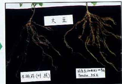
大豆(左)未施藥(右)施好年冬