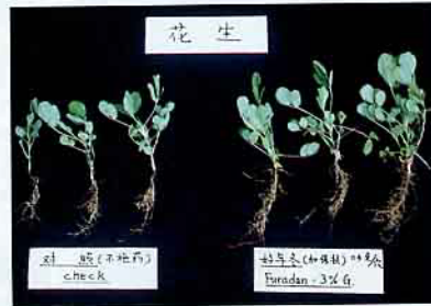
花生(左)未施藥(右)施好年冬