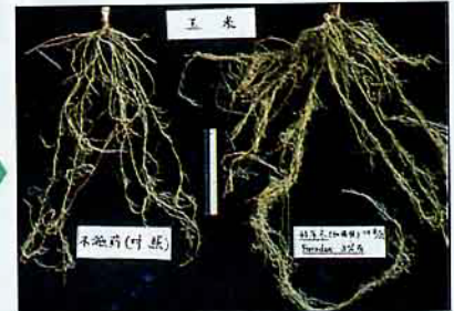
玉米(左)未施藥(右)施好年冬