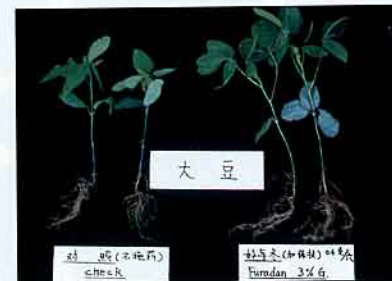
大豆(左)未施藥(右)施好年冬