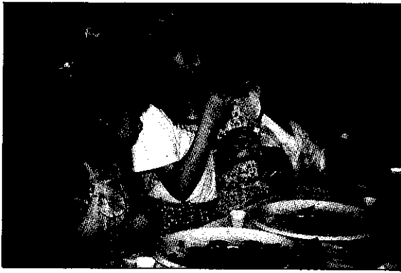
毛豆品嚐