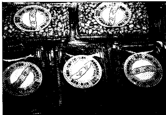
促銷產品

這次活動最主要部份是毛豆、紅豆，看板介紹毛豆生產現況，毛豆栽培面積由72年之5,000公頃到81年10,500公頃，10年增加一倍，可見其發展潛力。產量由72年每一公頃5,630公斤到81年提高每公頃7,291公斤，增產指數達29%。為提高外銷競爭力，採用機械收穫，可使每公斤毛豆採收成本7元降為4元。紅豆利用撒播方法及豆類聯合收穫機大幅降低生產成本。毛豆新品種有高雄選一號、高雄二號與三號。紅豆品種有高雄三號、五號與六號。這是高雄區農業改良場近年來致力於品種改良具體成果，新品種推出後受到南部農民歡迎喜愛。毛豆營養價值，