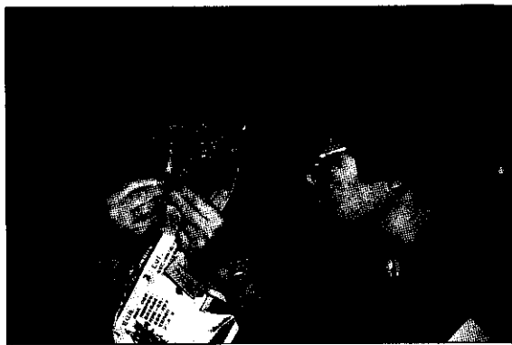
毛豆品嚐