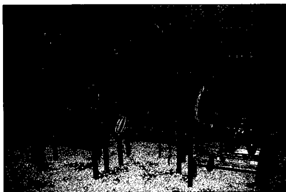
休閒作品 (楊文振 / 攝)