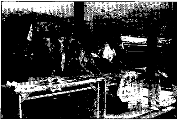
「豐年社」派專人與會設攤傳書香