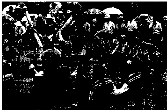
南庄鄉舉辦桂竹希望之旅活動，當地賽夏族住民在會場跳山地舞，同時亦在舞場中央槌打山地糕（俗稱糍粑），吸引不少觀眾欣賞

鄉農會為配合「桂竹希望之旅」活動掀起高潮，首先邀請當地賽夏族原住民婦女身著傳統式的服裝表演山地舞，以優美旋律播放，一舉一動非常整齊劃一，婆娑起舞，震撼山嶺；在場觀眾皆報以熱烈的掌聲不絕於耳，旋由當地原住民長者準備杵臼、粟米（通稱小米）及一些材料等，合力抬至會場中央，首先由原住民利用「一」型杵（客家人則利用「T型杵」）槌打至少要有三人，二人執杵面對面站立，一人持一盆水坐在臼旁，執杵者一上一下揮杵椿臼裡的粟米飯，很有節奏，隨後供機關首長、嘉賓與民衆小心翼翼槌打山地糕（俗稱麻糬或糍粑），一般平均一椿臼的茲粑要10～15分鐘才能槌打好，然後將茲粑分成一小塊沾上花生粉、白糖、糕粉、白麻子等配料，美味可口。香