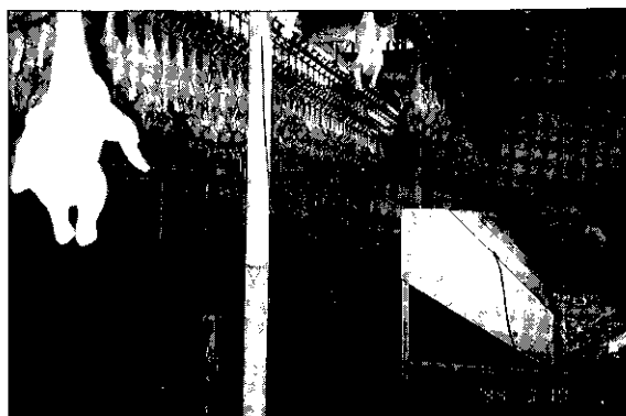
參觀南台家禽電宰場的自動分級及手工包裝情形

畜產經營利潤分析：飼養成本、家禽規模有大有小、有專業有副業。（直接成本）有子禽費指小雞的錢，人工費、農場的人工管理費、飼料費、醫藥費、材料費、家禽墊料、水電費、燃料費、瓦斯費（保溫用的）。（間接成本）建築物的折舊、修理、投資等費用、資本利息……農機具折舊、租金、租地或租農舍及排泄物處理費。若能具備成本的觀念、隨時精打細算、花錢就是爲了賺錢、時間就是金錢，每日確實作記錄、物料採購適時、適量、適價、注意農情報導、要有降低成本的決心與魄力、要有財物管理的觀念，則包管你的經營管理一定成功！