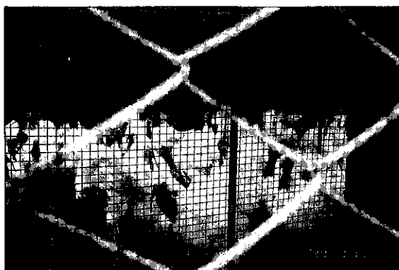
參觀台灣省畜產試驗所屏東分所的火雞飼養場

進小雞前1週需將雞舍和器具都清洗乾淨、並徹底消毒。前4小時育器內的溫度先調好約33.2~35.0°C，並準備新鮮飲水，水溫需18°C，小雞能在孵出後24小時喝到最好。濕度約需70%，保持地面的乾燥，太乾燥也不好，雞腳會有枯乾、發育慢，此時需在