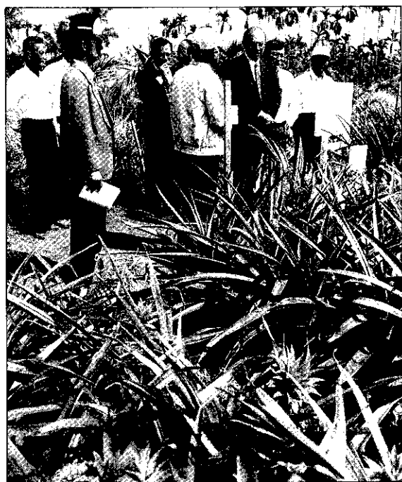
新品種命名時，專家們到現場看鳳梨生長情形