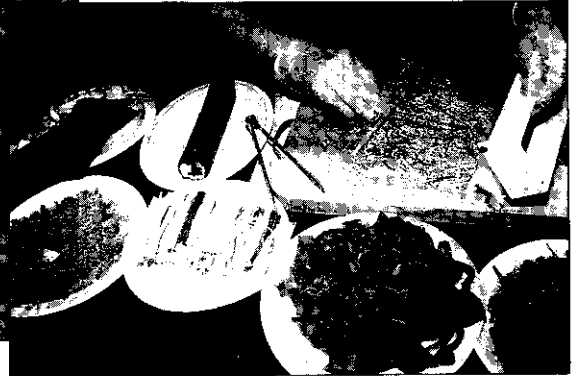
現場製作米食加工

標誌與制度，將高品質、健康及安全根植消費者中，不但可提升農民收益，同時亦能面對外國進口之挑戰。