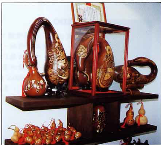
利用農產品做成的裝飾品