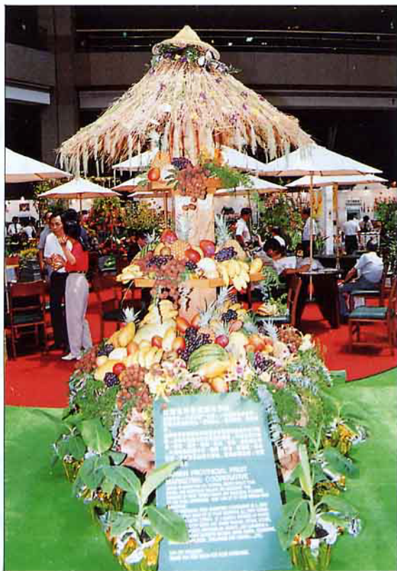
展覽會一角——豐富的台灣水果

由中華民國對外貿易發展協會主辦，及全省各農業食品相關公會協辦的「1994台北國際農產暨食品工業展」，已於83年6月26日假世貿中心展覽大樓舉行。來自國內外518個廠商（1325個攤位）共襄盛舉，同時亦是自民國77年執行以來，規模最大的一次。