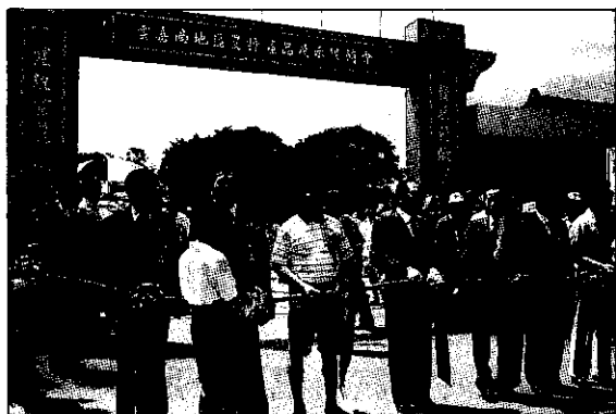
台南區農改場舉辦自80年3年來第十二次農特產品展示促銷會