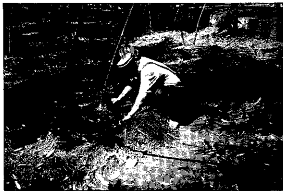
要竹筍長得好，首先重管理技術

證價格及交貨期限等條件，原料價格綠竹筍每公斤新台幣10.5元，麻竹筍每公斤4.4元，交貨期限為6~10月底。此契約共同運銷之價格雖然不很高，但具有收購保證，對農民來說是一個生產收益的保障，風險也就減少很多。