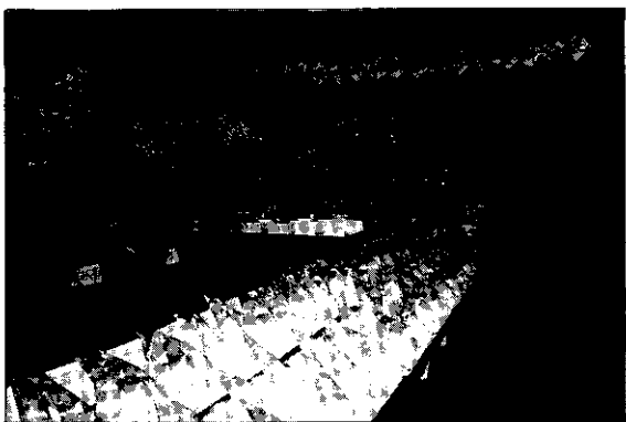
長治鄉舉辦綠竹筍競賽，參加的競賽產品擺滿會場