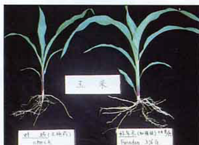
玉米(左) 未施藥(右) 施好年冬