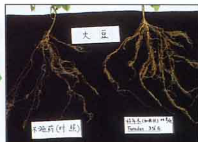
大豆(左) 未施藥(右) 施好年冬