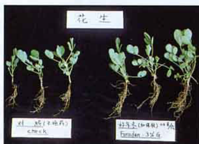
花生(左) 未施藥(右) 施好年冬