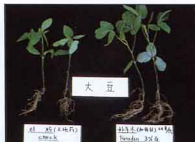
大豆(左) 未施藥(右) 施好年冬