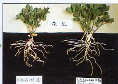
花生(左) 未施藥(右) 施好年冬