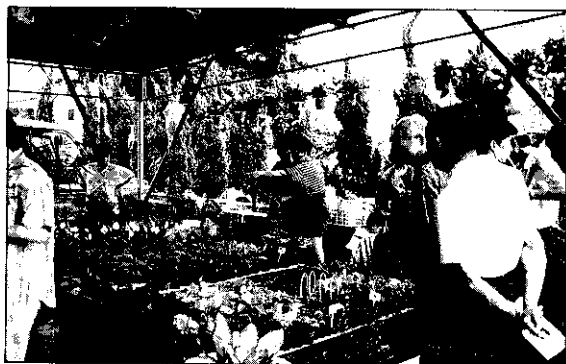
展售花草植物盆栽的攤位，吸引許多人觀賞。

在活動中心的會場裡有多項成果展，一進門就被亮麗的插花作品吸引，從每件作品裏，都可以看到作者的用心和意境，抬頭映入眼簾的是歷次的農民教室成果實況，有中西餐點班製作餐點時的辛苦；手工藝社、紙藤社及陶黏土社上課情景，大大小小的作品，比市面上的產品還更勝一籌，顯示了八里