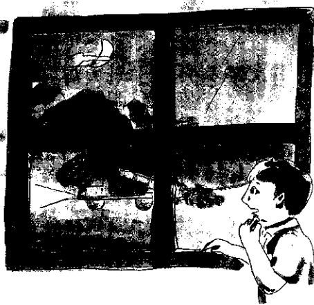
文文在晚上聽見海堤邊，有卡車來倒垃圾。

「爸 三一〇 爸 三一〇 ，昨 三一〇 天 三一〇 晚 三一〇 上 三一〇 我 三一〇 起 三一〇 來 三一〇 上 三一〇 廁 三一〇 所 三一〇 ，聽 三一〇 見 三一〇 海 三一〇