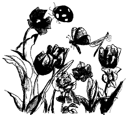
饅頭山上有好多種昆蟲快樂地生活在一起。