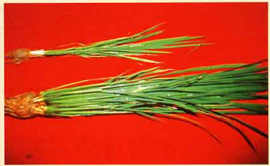
(上) 水稻被害狀 (對照) (下) 施用好年冬3%粒劑