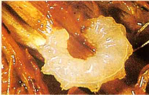
水稻水象鼻蟲幼蟲 (爲害水稻根部)