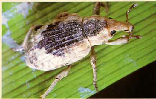
水稻水象鼻蟲成蟲 (爲害水稻葉片)