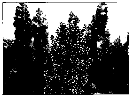
「台南6號」高粱結穗情形。