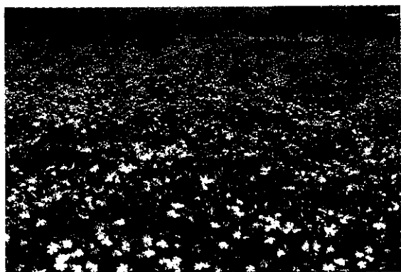
香花栽培是台東地區頗具發展潛力的產品之一。