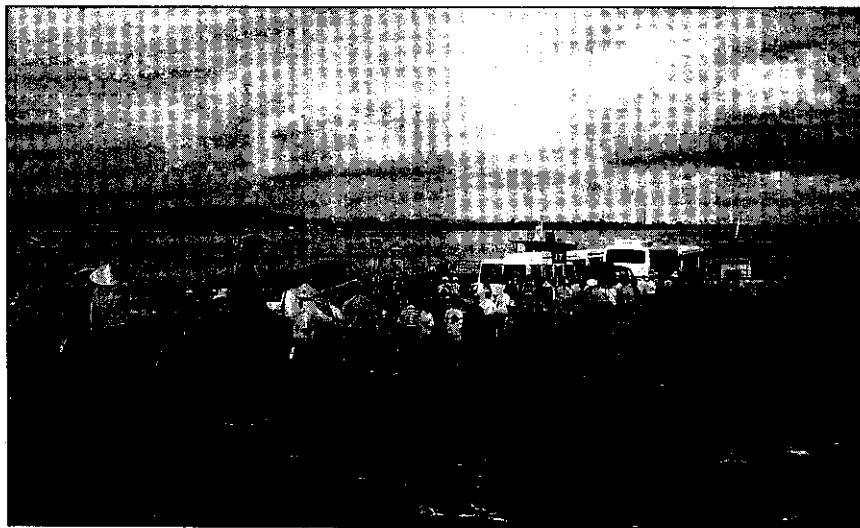
越南經歷戰亂，百業正待從頭做起。