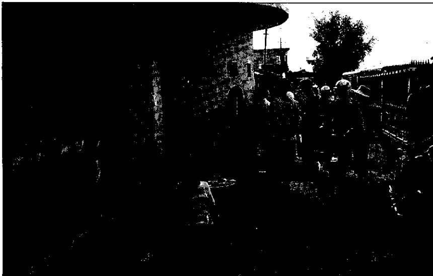
越南的民風淳樸，圖為小市民在街頭拜天祈禱一景。

5. 西部高原：年雨量達1,800-2,400公釐，人口密度45人／平方公里，產物包括橡膠、茶、咖啡、水果、家畜、蔬菜、稻