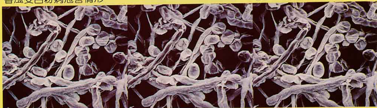
地吉處理後之白粉病孢子