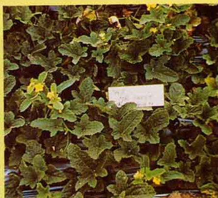
地吉處理後之效果