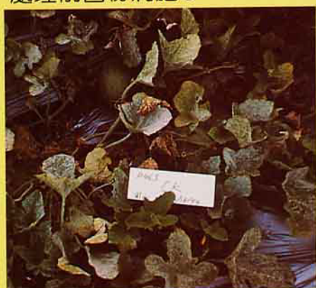
香瓜受白粉病危害情形