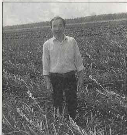
熱心負責農會主辦“阿三哥”