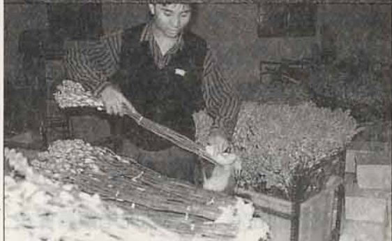
▶ 在集貨場裡調理分級