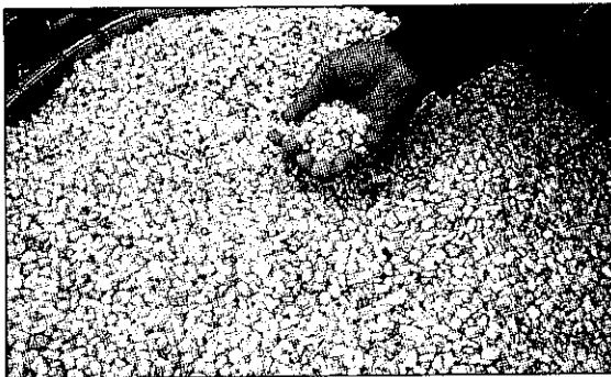
用綠肥作物來輪作，雜糧就豐收