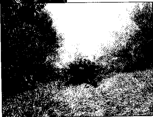
▶ 新型高速噴藥機在山邊溝上作業，不但用藥量減少，功效又快又徹底。