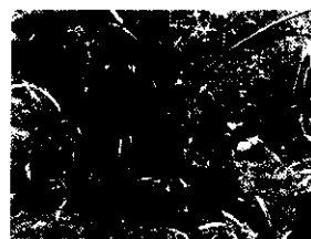
(三) 移植時可保留大部分枝葉樹型，生長不受影響，永保長綠。