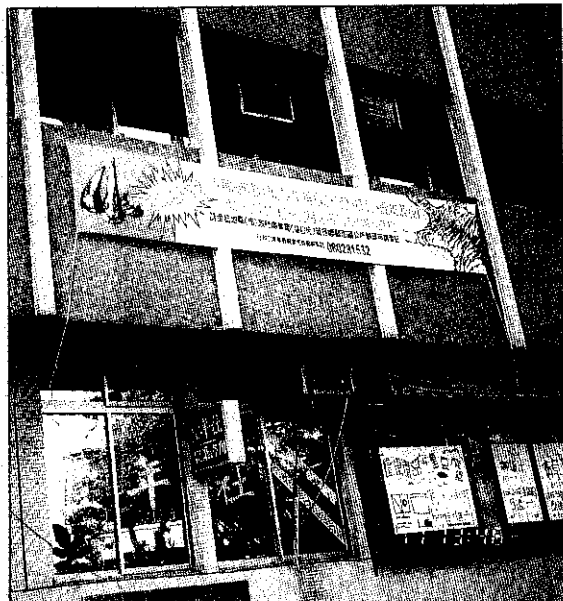
按規定辦理，保育類野生動物登記、註記，就是實行保育的第一步。

4. 兩生類——台灣山椒魚、楚南氏山椒魚、台北樹蛙、翡翠樹蛙、莫氏樹蛙、褐樹蛙、黑蒙西氏小雨蛙、巴氏小雨蛙、史丹吉氏小雨蛙、虎皮蛙、杉木蛙、台北赤蛙、貢德氏蛙。