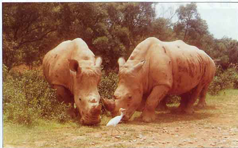
好好保護野生動物，讓我們的子孫能夠看到野生動物的美麗長相。

保護野生動物，使牠們能世代與人類同時生存於地球上，是目前時代趨勢，也是做為一個現代人的責任。我們應拒捕、拒殺、拒吃野生動物，更應以佛教眾生平等，慈悲為懷的心情去愛護牠們。