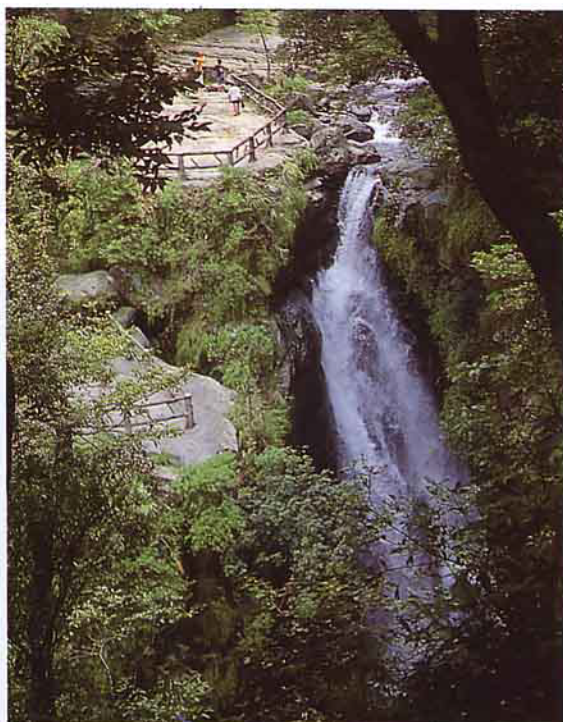
◀ 遠眺滿月圓瀑布及瀑頂平台