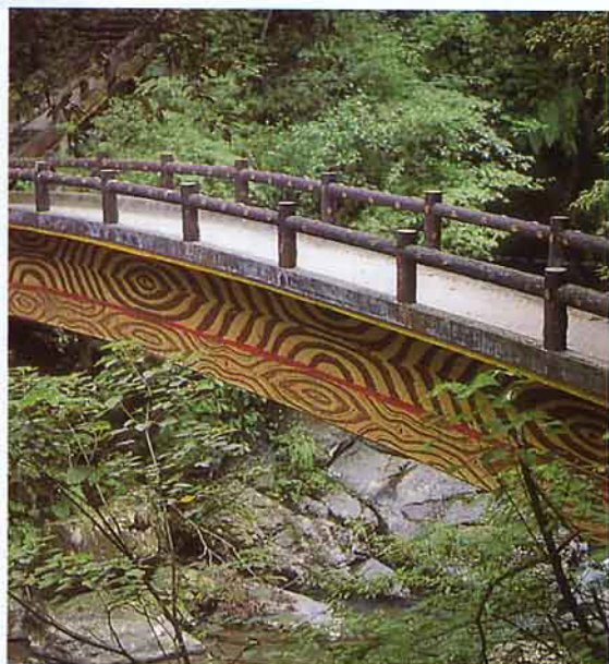
通往滿月圓瀑布的楓林小橋