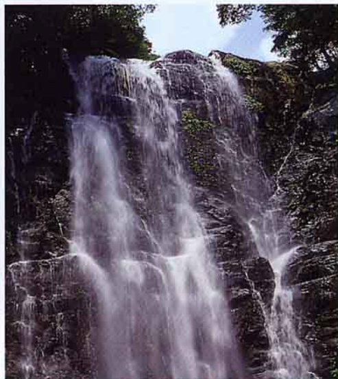
森林浴的好去處——處女瀑布

本區最有名的瀑布有滿月圓瀑布及處女瀑布，其中滿月圓瀑布造形及氣勢最爲奇特壯觀，瀑布旁有梯階通往瀑頂岩石平台，平台可供遊戲及遊憩別具原始風味，而處女瀑布瀑身寬廣，雨季水量特別豐沛，置身瀑旁享受水珠