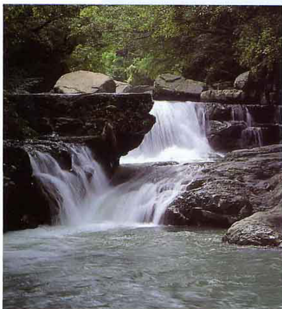
溪流是滿月圓森林遊樂區內的主要景觀