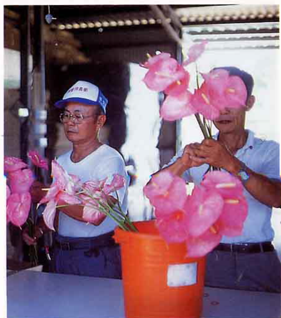
▲ 火鶴花共同選別分級作業