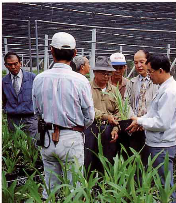
▲ 由市農會邀請專家學者實地診斷指導