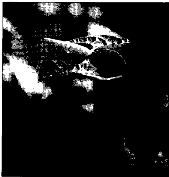
紅色火鶴花

嘉義市盧厝區段原為稻作生產區，於民國73年率先響應政府稻田轉作政策而轉作柑桔類果樹，並在有關單位輔導下成立了果樹共同經營班，幾年下來共同經營班之組織運作相當健全，班員間有很強的團結性。班產品如柑桔、葡萄柚因實行嚴格的分級包裝和共同運銷，產品在市場上建立了良好的口碑和品牌，雖然有如此好的成績，但抵擋不了連續多年的柑桔價格低靡不振而不敷成本，班員眼見柑桔產業已日漸衰頹，又隨之而來的加入世界關貿總協定（GATT）的強力衝擊，在此內憂外患的壓力下，終於激發了班員自我調適的危機意識，於是積極尋求替代作物，期