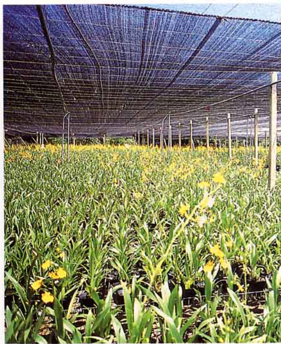
▼ 文心蘭專業栽培欣欣向榮