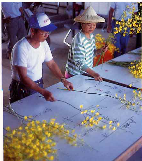
▲ 文心蘭共同選別分級作業