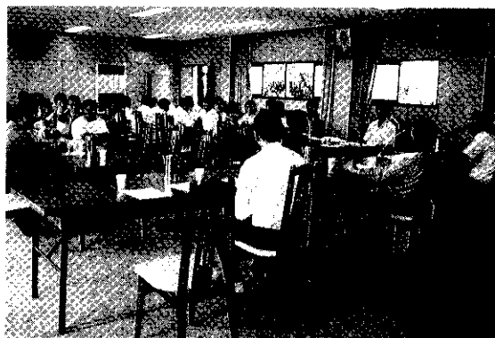
冬季裡作大宗蔬菜產銷會議現場