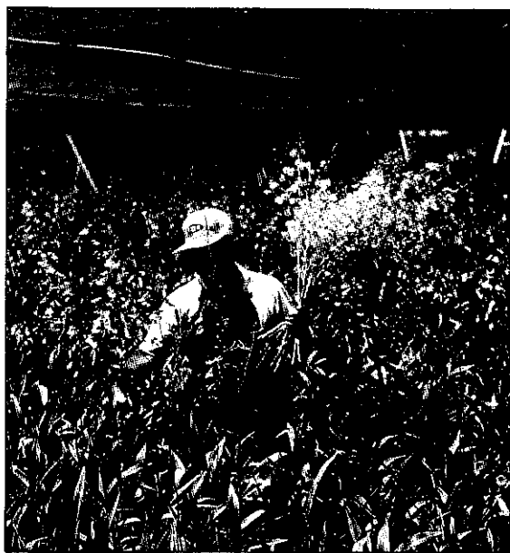
看花、賞花是樂事，可是誰知花農心事？