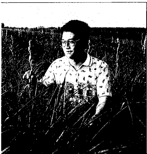
晚香玉栽培雖鎖定外銷日本，可是成績欠理想

時下許多人都認為政府未來若加入GATT（關稅暨關貿總協），在台灣農業中，花卉比起糧食作物的水稻、玉米、高粱等是較有競爭能力的作物，於是乎農村目前興起了一番種花熱，其栽培面