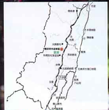
富源森林遊樂區地理位置圖

本省由於地理區隔，東部與西部發展呈現顯著差異，西部平原開發迅速，工商普遍發達，但也付出了生活品質日益惡化的代價，人們休閒去處普遍缺乏；反觀東部，工商業不若西部發達，但卻保