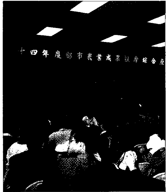
省農會舉辦的「84年度都市農業成果觀摩座談會」

設為農業生產的場所，休閒旅遊的園地，也是消費的地方。推動直銷與引導市民到園內購買。