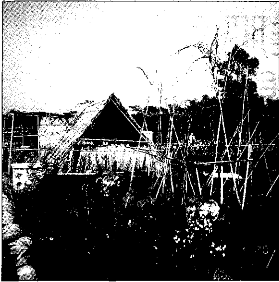
龍潭鄉的市民農園