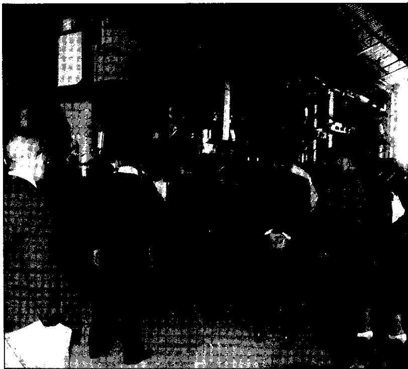
稻米產銷一元化的設備，大家來觀摩一番

後龍鎮為一典型農業鄉鎮，主要作物以水稻為主，兩期耕作面積4,443公頃，年產量達21,326公噸，先天地理環境雖好，但以往農民卻忽略米質之重要性，致影響稻米銷售數量及價格，鑑於此，後龍鎮農會乃積極策劃，實施稻谷產、製、儲、存、銷，一貫作業計劃，以企業化的經營管理，先後設立了稻谷乾燥中心與自動磅精米機，精製選米機等機械設備，並成立農產運銷組，藉以控制並確保米質及掌握市場，彌補缺失，提高農民所得。