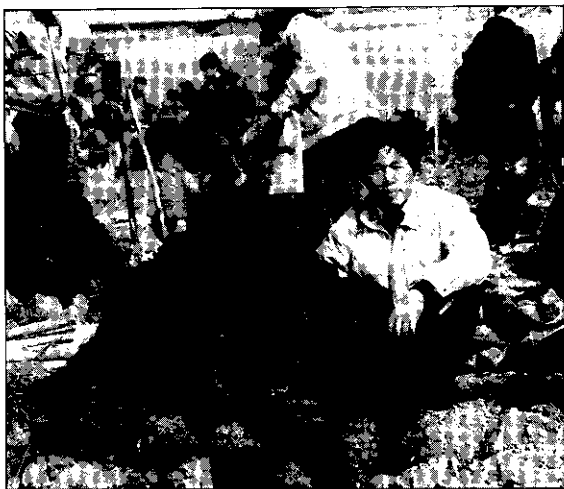
◀ 將窯土燒紅，等待香噴噴的食物出「土」