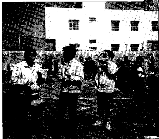
◀ 你看！他們吃出「土香」、「瓜香」、「米香」，一身香

窯大活動，每組8人，由鎮農會供應地瓜（番薯）、玉米每組各10條，及燒窯土用的木材及火種，參加的農友在田間用土塊砌土窯，然後用木柴將土塊燒紅，再從窯的頂端放入地瓜、玉米等材料，然後覆蓋窯土煨熟，約經50分鐘左右，挖開窯土，取出地瓜、玉米，大家吃得津津有味，玩得亦很開心。