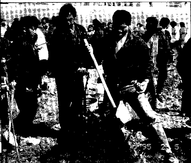
▲ 從窯頂端放入玉米、地瓜等