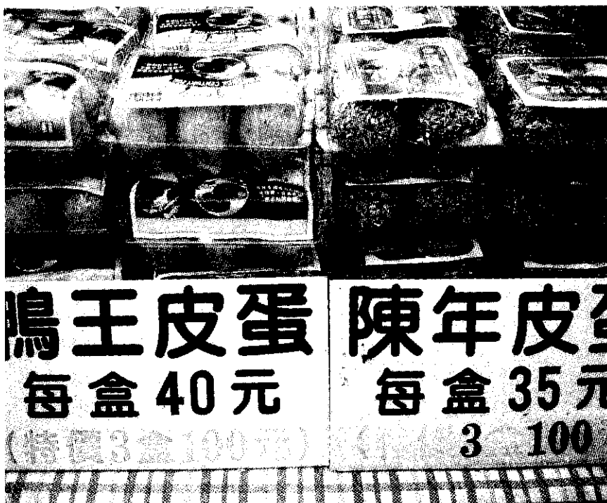
台南縣養鴨生產合作社出產的主要產品「鴨王皮蛋」「陳年皮蛋」

人家都喜歡採自己生產自己賣的方式去經營，在這種情況下，除容易產生產銷不平衡的現象，長期的影響更會使得「產地價」一直處於低迷情況。「我們也曾經想成立集貨場甚或拍賣市場，可是想到鴨蛋通常是要經過加工才能上市，就覺得困難度滿高，所以我們也只好自求多福啦！」