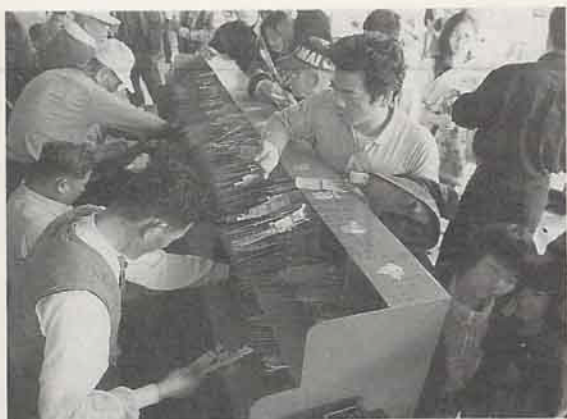
信徒繳費領取解厄紙(紙人替身)(台南市土城聖母廟)