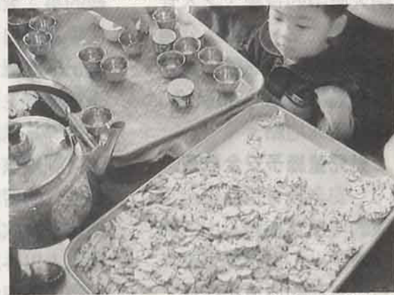
解運後，喝平安茶，領取符仔紙 (土城聖母廟)