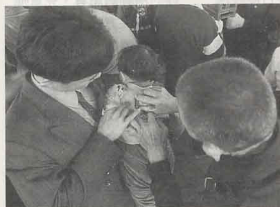
蓋神印 (土城聖母廟)