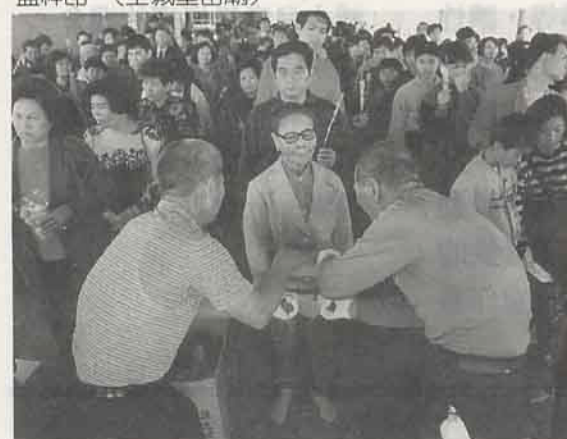
手轎作法解運 (土城聖母廟)