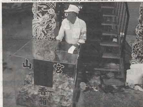
過七星橋消災解厄前 先將香油錢100元塞入透明錢櫃