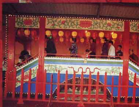
七星橋正面，信徒漫步橋上 (土城聖母廟)