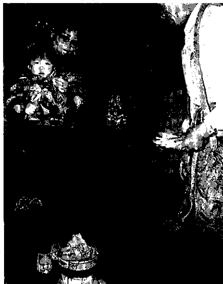
▶ 信徒(母女)跨越烘爐 (鹿耳門天后宮)

「七星驅邪祐平安，法橋步上消百劫。」這是七星橋尾的對聯，由此可知，設置平安橋的意義，在於改去信徒厄運，使信徒去霉運後招來好運，庇佑全家平安，事業發達，而且七星橋在本省民間信仰中，是一種辟邪解運的祈安祭儀，不分性別、年齡都可以參加，其消費額低，人人都玩得起。