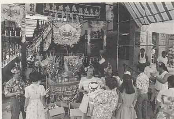
過七星橋後，紅頭仔持法鈴替信徒作法解運 (台南縣西港鄉慶安宮甲戌年王船醮典)