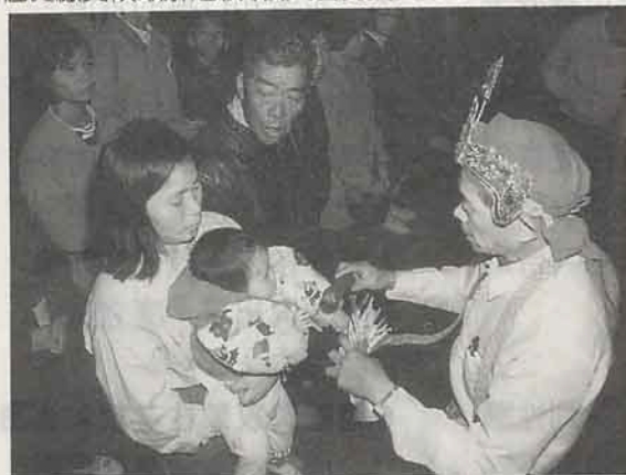
紅頭仔持法索、法鈴替信徒作法解運(鹿耳門天后宮)