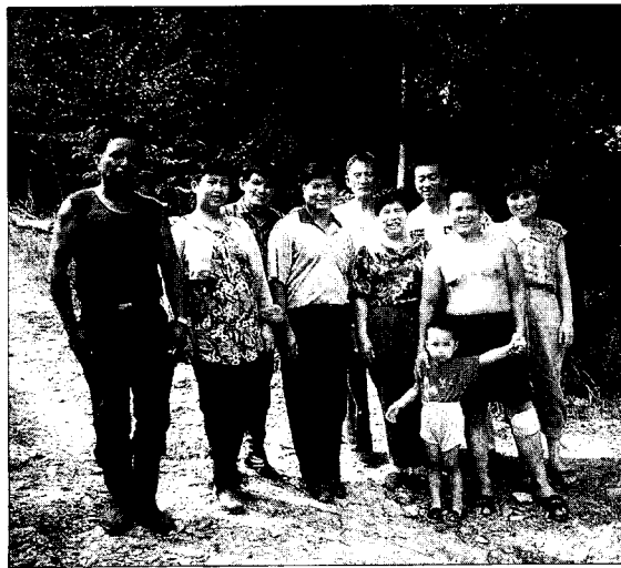
前往桃園縣復興鄉探訪原住民農友