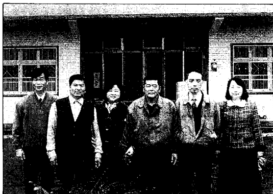
頭份鎮黃總幹事(右四)一行人到訪