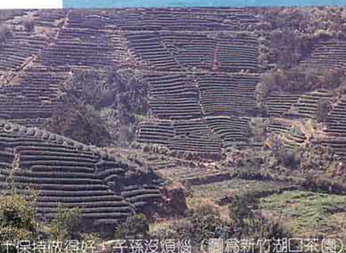
水土保持做得好，子孫沒煩惱。(圖為新竹湖口茶園)