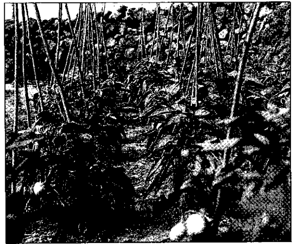
香瓜梨田間栽培情形