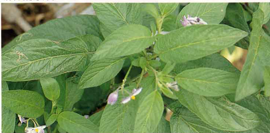
香瓜梨長卵形葉片