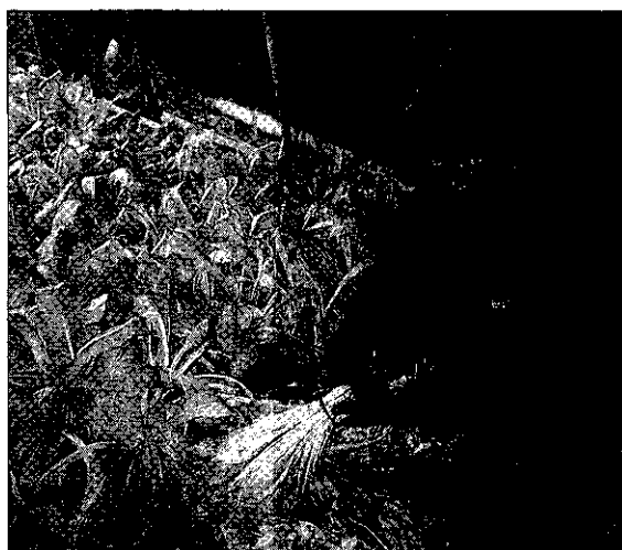
園裡的蔬菜，不僅用藥安全，而且詳加記錄