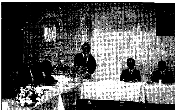
農政長官蒞臨指導