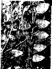
結實纍纍之愛玉子

(本場愛玉種苗區，曾經：省農林廳及台視、中視、農情新聞報導及中廣電台特別採訪播報)