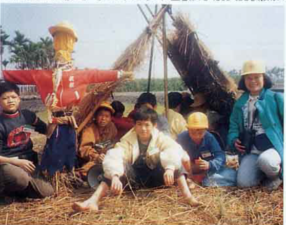
讓小朋友透過紫稻草人更了解水稻