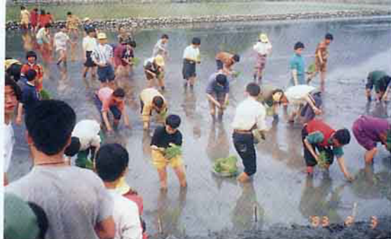
來！讓我們下田插秧吧！