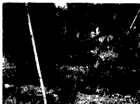
(一)種植時可當一般容器使用，淨水力量強，對於不易移植或移植有障礙之樹種特別有利。

庭木移植的新趨勢 栽培容器的新選擇 移植庭木的好幫手 移植搬運簡單又方便 不受移植影響而可永保長綠