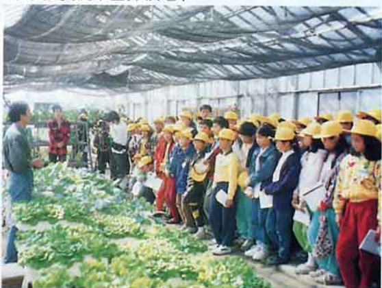
彰化管理處辦的「學童米鄉冬令營」讓小朋友認識蔬菜