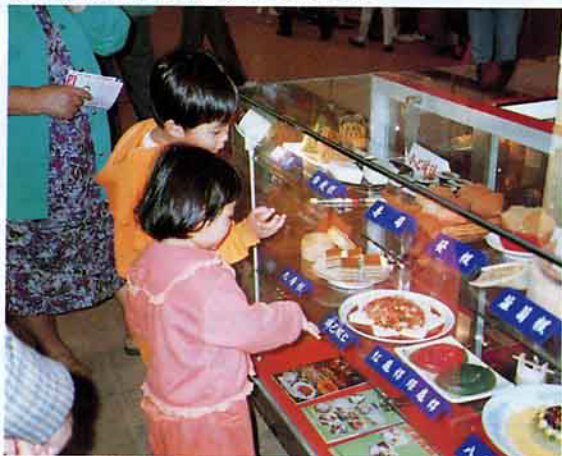
▲在台中管理處辦的活動中有米食成品展示櫥，從小朋友看得津津有味的神態中，就可知，教育下一代多吃米食功能已在發揮