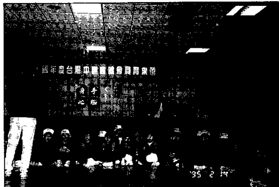
難得相聚，大家來排排坐

由嘉義縣主辦的84年度台灣中區四健會員育樂營活動於2月13~15日在嘉義縣番路鄉龍頭休閒農場〈龍頭山莊〉舉行，來自各地如台中縣、台中市、南投縣、彰化縣、雲林縣、嘉義市等縣市農會的四健會員約240人餘人，在精心設計的行程及課程安排，寓教於樂，度過了三天的歡笑時光，亦達到四健會從工作中學習。