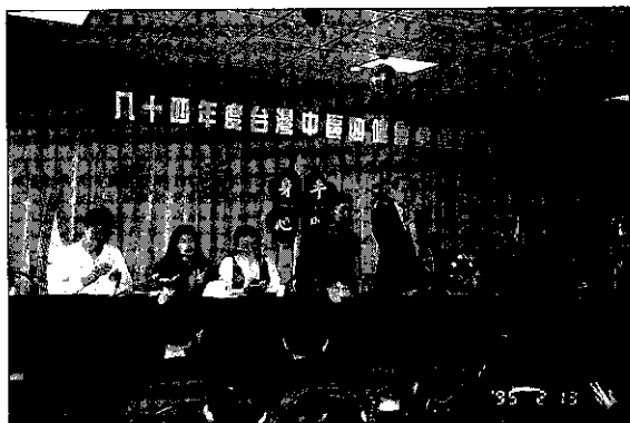
大哥哥、大姐姐跟我們同樂