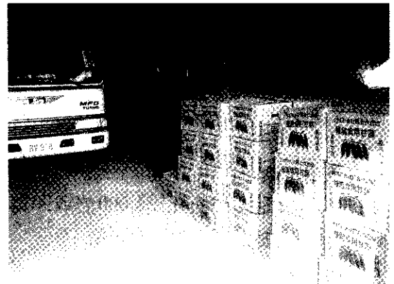
後龍鎮甘藷分級包裝共同運銷果菜市場

於半畦上，再犁蓋藥，作成畦後插植藷苗，若以機械整地作畦者，在整地前均勻施於田面後立即耕翻之。