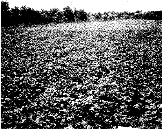
甘藷桃園一號生長情形