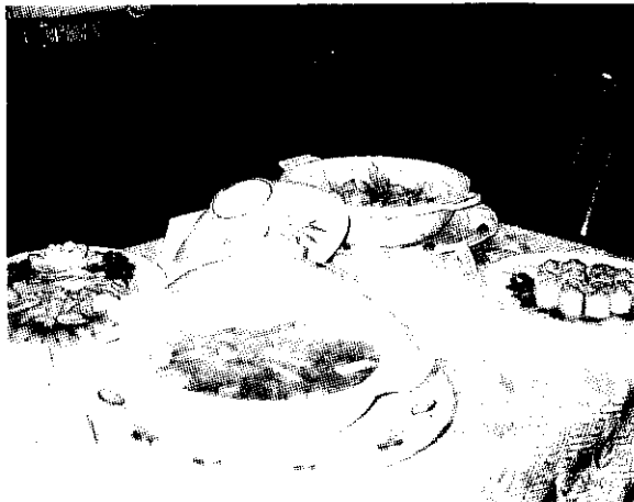
▲竹筍大餐令人食指大動