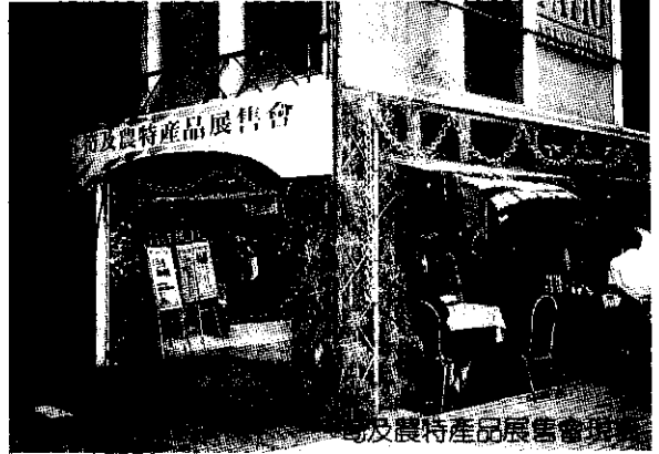
竹及農特產品展售會現場