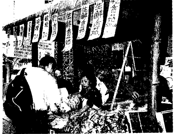
▲來自竹、苗地區的農特產品吸引不少民眾前往選購

春 雨過後，初夏時節，竹林裏紛紛冒出青嫩的筍尖，又是老饕們細品竹筍佳餚的時候了。桃園區農業改良場，苗栗縣農會、新竹縣農會於5月23日在台北環亞大飯店舉辦以筍為主題的農產品特展，由廚藝高超的大師精心調理的筍之頌、竹製家具用品展以及竹、苗地區農會的農特產