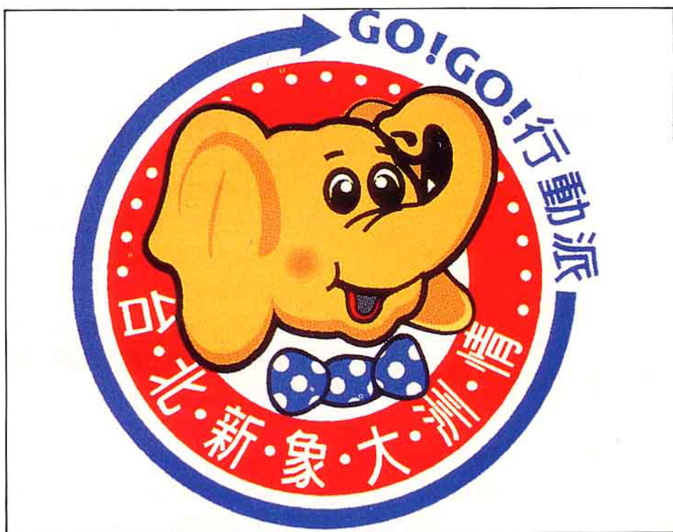
前任台北市長黃大洲去年競選時的CIS，生動鮮明

去年底台北市選舉中，滿街的黃色大象旗幟，加上「台北、新象、大洲情」這個口號，再配上誠懇拜託的模樣，您想到了誰？四手相連的綠色旗幟、「快樂、希望、陳水扁」的標語加上親切的微笑，是否讓您想起陳市長的樣子？象徵土地希望的樹木與土地的圖案、「最亂的時代，最好的選擇」，以及振臂高呼的形象，又讓您想起誰呢？這一整套有系統的策略，從視覺上的標誌，到候選人政見的口號，加上帶給選民不同感受的競選態度等，正